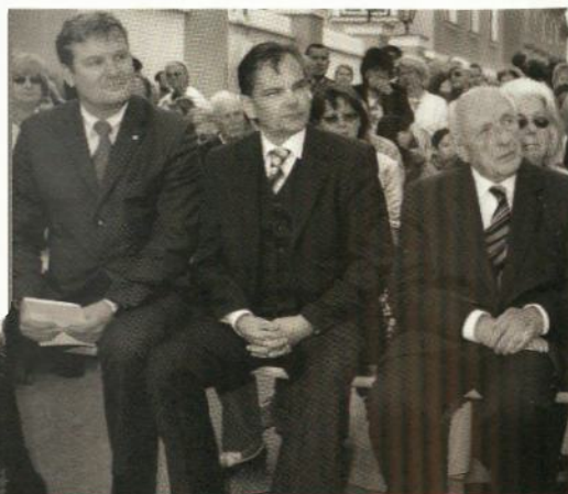
10. Juni 2005: Die Übergabe des neuen Hauses des Hilfswerks in Laxenburg

Jahreshauptversammlung in Laxenburg (Referat: „Ist die Bildung unserer Kinder in einer Krise?“) Jubiläum 20 JAHRE HILFSWERK LAXENBURG mit Kabarett DOKTORS BEST und Straßenfest Präsentation dieser Festschrift