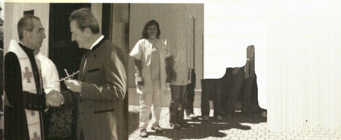
Festakt, Segnung und Straßenfest