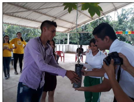
Imagen 7. La comunidad educativa de la IE EL Cristal sede Colinas hace entrega de un souvenir a la comunidad en proceso de reincorporación del ETCR Colinas durante el Conversatorio de Paz ETCR Jaime Pardo Leal – Vereda Colinas.

Por parte de los estudiantes de las diferentes Instituciones Educativas se formularon preguntas acerca de las percepciones del proceso de paz en el departamento del Guaviare, cambios en la región luego de la firma de los Acuerdos de Paz, y dificultades de la reincorporación. Estas preguntas fueron dirigidas a las instituciones ONU, ARN y a la población excombatiente, que sirvieron como dinamizadoras para que los participantes se reconocieran.