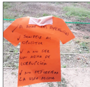
Imagen 8. Compromisos frente a la paz en el Conversatorio de Convivencia Ciudadana para la Paz y la Democracia

Generar Acuerdos: en este momento se realizó un tendedero de acuerdos en donde los distintos participantes dejaron plasmado su compromiso hacia la paz. Finalmente se realizó un recorrido por los diferentes espacios productivos (fábrica de bioabonos, cultivos en invernadero, cultivos de pan coger) y áreas comunes (viviendas, comedor comunitario, escuela, biblioteca, espacio pedagógico de trincheras) 8 .