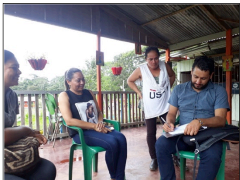
Imagen 5. El equipo técnico de HWI hace una visita de inscripción al cuerpo docente de la IE El Cristal sede Colinas. Junio 13 de 2019

Para consolidar un listado de participantes 4 de acuerdo con lo proyectado en el Plan metodológico del Diplomado, y debido a algunas dificultades para contactar de forma directa a los docentes de las Instituciones Educativas y a la comunidad, se realizaron nuevos acercamientos para motivar la participación de toda la comunidad educativa y otros beneficiarios. Fue así como en las primeras semanas del mes de junio de 2019, el equipo de Hilfswerk se acerca nuevamente a la IE José Miguel López Calle en el Corregimiento El Capricho, IE El Cristal sede Colinas, IE El Cristal sede Picalojo, IE Carlos Mauro Hoyos del municipio de Calamar e IE La Libertad.