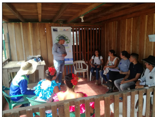
Imagen 1. Reunión equipo impulsor Vereda Colinas. 18 de julio de 2019.

Para dar cumplimiento a este objetivo se realizaron reuniones en las Veredas Colinas, Cerro Azul, Puerto Nare y Carpa, los días 18, 19, 24 y 25 de julio respectivamente. A estas reuniones asistieron docentes y estudiantes de las Instituciones Educativas Colinas, Cerro Azul, El Edén y Carpa, miembros de las Asociaciones de Padres de Familia, miembros de las Juntas de Acción Comunal - JAC y líderes y lideresas de las comunidades de las cuatro veredas mencionadas