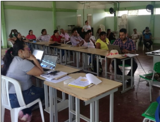
Imagen 4. Estudiantes y docentes de la IE Caño Blanco II atienden a la presentación del diplomado Escuela Vereda Innovadora el 27 de mayo de 2019.

Del núcleo Colinas de San José del Guaviare, se realizó un acercamiento a la IE José Miguel López Calle – sede principal, del Corregimiento El Capricho. IE El Cristal – sede Colinas , de la vereda Colinas en la que se logró hacer un acercamiento con cinco (5) docentes de la sede. IE El Cristal – sede Picalojo , de la vereda Picalojo y a la IE El Triunfo II - sede Caracol , en la que se tuvo la oportunidad de participar en el Concejo Académico, contando con la participación del Rector de la IE, dos (2) docentes, dos (2) padres de familia y un (1) estudiante.