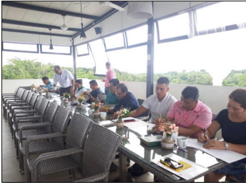
Imagen 2. El 16 de mayo de 2019, Directores rurales y representantes de la SED participaron de la reunión de socialización del diplomado Escuela Vereda Innovadora.

El proceso de acercamiento a estas IE se dio en primera instancia con una reunión con directivos y funcionarios de la SED para socializar el desarrollo del diplomado, la población objetivo, la modalidad itinerante, la metodología de ejecución, y así conocer su percepción frente al mismo. Esto teniendo en cuenta su rol como beneficiarios directos del proceso y la oportunidad de que sirvan de agentes para motivar la participación de sus comunidades educativas (docentes, padres, madres, líderes comunitarios veredales o municipales).