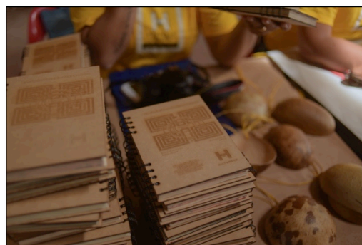
Imagen 5. Agendas diseñadas para los participantes participantes del Evento de lanzamiento del 02 de julio de 2019.

En relación con la etapa previa al evento de lanzamiento el cual se realizaría el día 02 de julio de 2019, el equipo técnico de Hilfswerk diseñó invitaciones para el día del lanzamiento, junto con una agenda personalizada que contenía información específica sobre cada uno de los módulos a desarrollar durante el Diplomado, a fin de que los participantes tengan un breve conocimiento de los contenidos a desarrollarse. Así mismo, la agenda tiene una funcionalidad de bitácora, de tal forma que los participantes puedan consignar la información relevante sobre los temas aprendidos 5 .