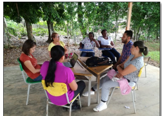
Imagen 3. El equipo técnico de HWI socializa con cuerpo docente de la IE El Cristal sede Picalojo, motivándolos a participar en el diplomado Escuela Vereda Innovadora. Mayo 22 de 2019

En el núcleo Las Damas se visitaron en el Municipio de Calamar, la IE Carlos Mauro Hoyos – sede principal y la IE Las Damas - sede principal. Por su parte se visitaron en el municipio El Retorno la IE La Libertad – sede principal, de la Inspección La Libertad y el Centro Educativo La Asunción , del Resguardo Indígena La Asunción. En estas Instituciones Educativas, se sostuvieron reuniones con directivos (rectores, coordinadores académicos), docentes y en el caso del Resguardo Indígena con la capitana del resguardo.