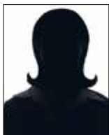
Referenten/innen Hilfswerk Österreich