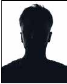
Referent/in ÖAMTC- Mitarbeiter/innen