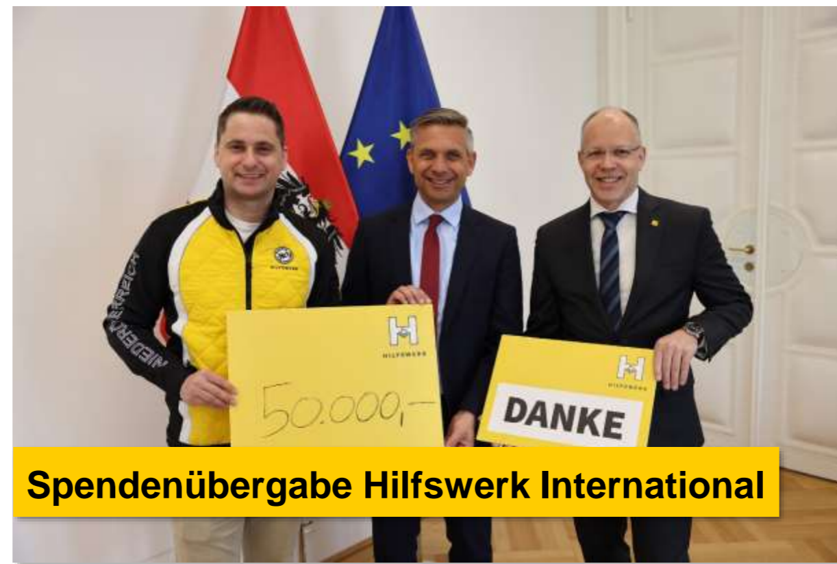
Spendenübergabe Hilfswerk International