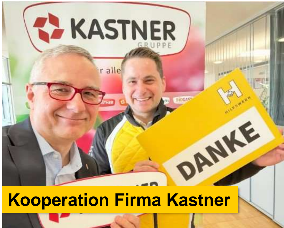
Kooperation Firma Kastner