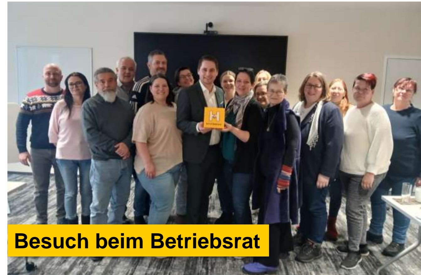
Besuch beim Betriebsrat