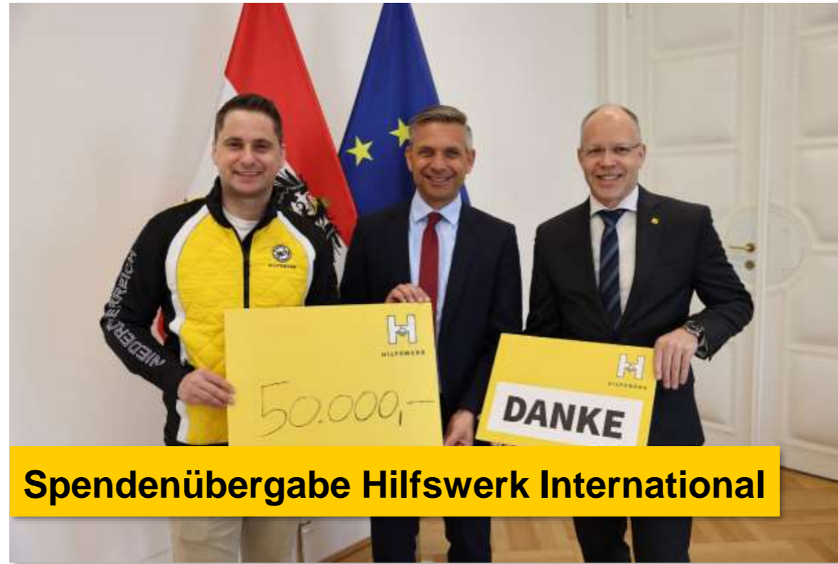
Spendenübergabe Hilfswerk International