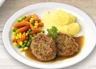
Kalbsbutterschnitzel mit Gemüse und Erdäpfelpüree