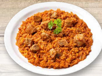
Reisfleisch Schweinefleischstücke in saftigem Paradeiserreis