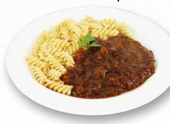
Saftiges Rindsschnitzel mit Zwiebelsauce und Spiralen