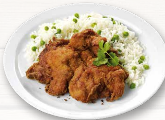
Backendl mit Erbsenreis