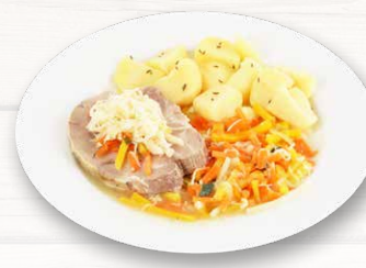
Wurzelfleisch „Steirische Art“ mit Wurzelgemüse und Kümmelerdäpfeln