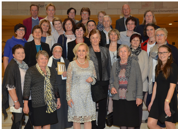
Anbei ein Foto vom gemeinsamen Besuch am 6. April 2017.

Danke für die Spende einer privaten Person, die diesen Besuch ermöglichte.