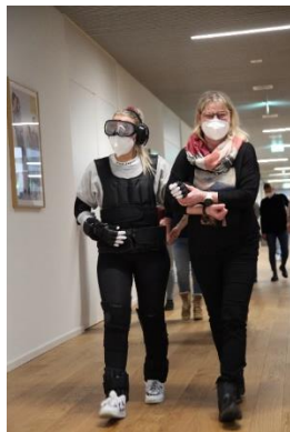
BU: Der Alterssimulationsanzug „GERT“ hilft den Teilnehmer/innen, sich in ihre älteren Kund/innen hineinzuversetzen.